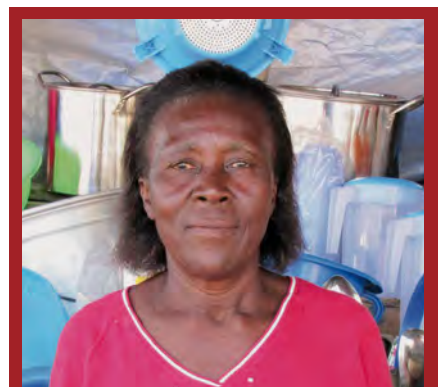
ROSIE - Léogane (Haïti)

Des efforts redoublés pour reconstruire sa maison