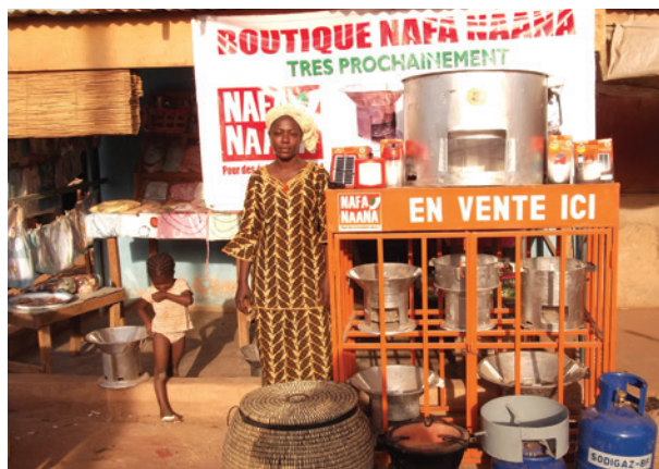
Revendeuse, microfranchise dans le cadre du programme Nafi Naana au Burkina Faso

Des solutions pour limiter le recours à des énergies polluantes et coûteuses existent : les foyers améliorés à biomasse permettent de réduire jusqu'à 50 % l'utilisation du combustible, et de diminuer les